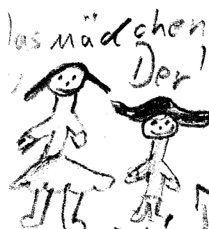
Das Mädchen Der

Das Mädchen heiratet schließlich den fliegenden Holländer.